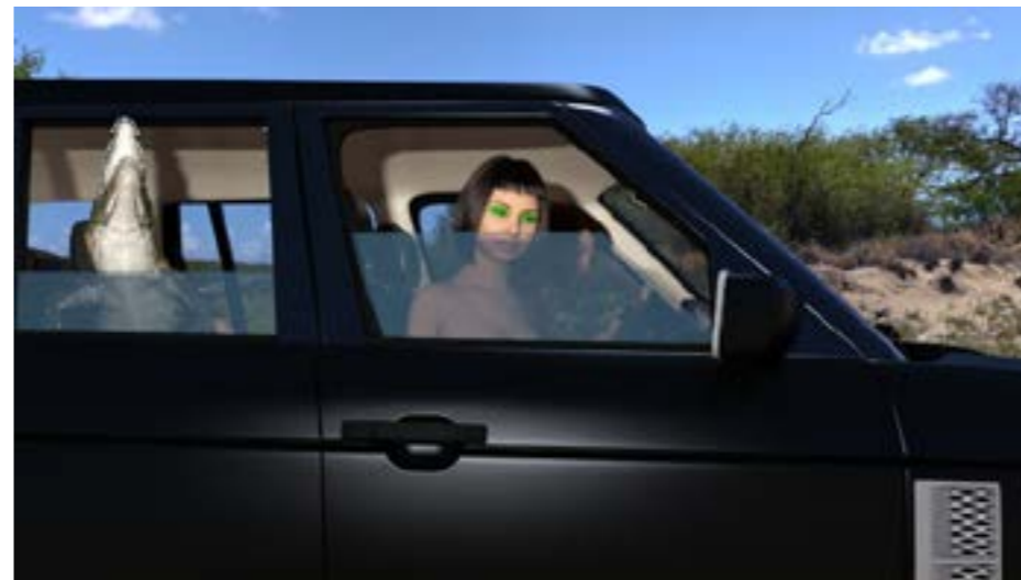
Olga Fedorova, Party Next Door , 2019 Hd animation, 1,01mins © Olga FEDOROVA (La Menuiserie/Novacitis, Me Myself and I )

AFL: L'idée d'investir des lieux alternatifs est profondément ancrée dans la question de l'impact. Si l'on se demande quel est l'impact de l'art, il est important de réinscrire la création dans des espaces qui ne sont pas des lieux dédiés à l'art