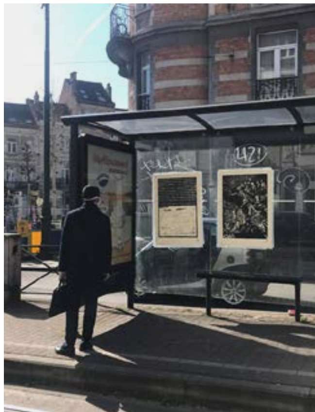
BIENNALE DE L'IMAGE POSSIBLE 2020 ARTS VISUELS & PHOTOGRAPHIE LIÈGE, DIVERS LIEUX WWW.BIP-LIEGE.ORG DU 19.09 AU 25.10.20